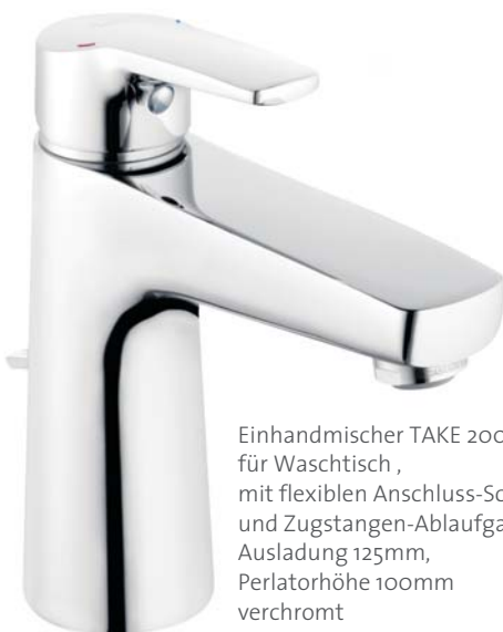
Einhandmischer TAKE 2000_2 XL für Waschtisch, mit flexiblen Anschluss-Schläuchen und Zugstangen-Ablaufgarnitur Ausladung 125mm, Perlatorhöhe 100mm verchromt

Die beliebte Armaturenserie TAKE 2000_2 wird um ein weiteres Highlight ergänzt. Die neue Waschtischarmatur XL bietet eine größere Auslauflänge und -höhe. Damit macht die neue XL auf allen Waschtischgrößen eine gute Figur und bietet noch mehr Komfort. Ab sofort im Sanitärverkauf erhältlich!